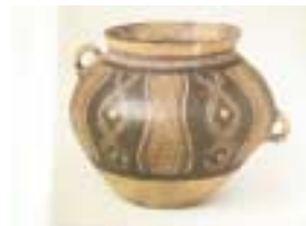
アンダーソン土器（「東洋陶磁大観9」、講談社、昭和51年、より）

もはや特別の人だけが所有する物ではなくなり、広く一般に使われる器へと大きく様変わりした。このように庶民の器になった後も、まれに桃山から江戸初期の織部紋様がみてとれるのである。