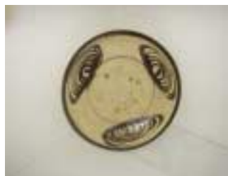
馬の目皿（江戸後期）

このように見えてくると、日本の中世陶器については、須恵器の技術が断絶し、まったく新たな焼き物が興ってきたということではないらしい。須恵器の還元焼成の乾いた肌から、鉄分が色ついた酸化焼成の肌、そして、人工の灰釉へと焼成法が変化し、それとともに器型も次第に変化して、近代的な焼物になってきたと考えられるのである。同様のことは、桃山陶としててもはやされてい