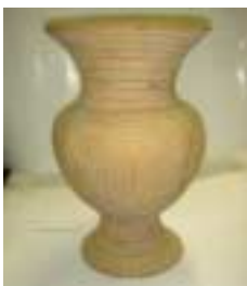
パンチェン土器 (タイ、BC5c)

多種多様な器が夥しい数生産されていたにもかかわらず、須恵器には、典型的な壺型の器は意外に少ない。かわりに、ラッパ状の大きな口づくりの広口壺や長頸壺が一般的である。そして、須恵器生産の末期近くになると、長頸壺や広口壺の口が次第に小さくなり、いわゆる私たちになじみの深い壺型になったと考えられる。わたしの壺は、平安末期の様式をみごとに備えており、須恵器の終焉期につくられたものと考えられる。したがって、わたしの壺は、須恵器から中世古窯へいたる過度期の器であって、古代から中世への橋渡しの役をしていたと思えるのだ。須恵器から、白瓷器、そして、六古窯の陶器へと至る細い道筋を示している器ではないだろうか。