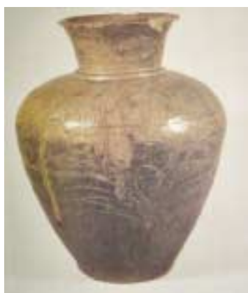
国宝秋草紋壺（「日本の陶磁古代中世編2」、中央公論社、昭和50年、より）