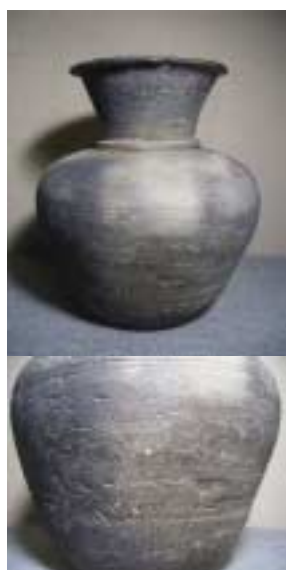
わたしの秋草紋壺（平安後期）

帰国してほどなく、目を患った。大学病院での手術は、初歩的なミスにより成功せず、一命はとりとめたものの、右眼を失うこととなった。眼科出身の早野学長にも世話になったが、あの態勢では