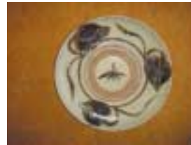
瀬戸台皿（江戸中期）

る志野、黄瀬戸、織部などについてもいえるのではないだろうか。これらの茶陶は、江戸初期を過ぎると、美濃や瀬戸の窯から忽然と姿を消してしまったといわれている。が、江戸時代の日常雑器の文様にその名残を、ままみとめることができるのである。下の写真は、江戸中期に焼かれた瀬戸の台皿である。この頃になると、陶器は