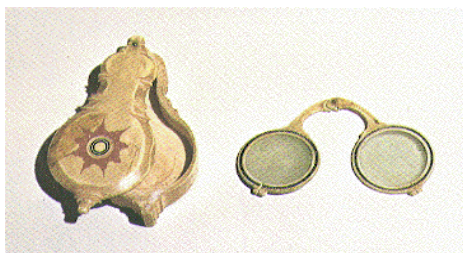
図6：第3巻76ページ。足利義政所持と伝える眼鏡とそのケース。折りたたみ式フレーム

た。平賀源内はその後10数個のエレキテルをつくった。現在は2個残っている。上の図が外観で、下の図は蓋をあけて内部を見せている。治療中の絵図が第3巻25ページにある。高さ28.2センチ、縦25.8センチ、横45.8センチの木製箱。