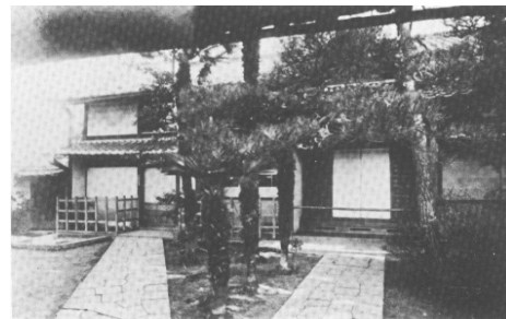
図8：第5巻253ページ 「ありし日の江馬蘭学塾」の写真。岐阜県の医跡とし

「やんめ」といわれたトラホーム類似の流行性眼病の治癒祈願のためのもの。病気快癒祈願のための寺院関係の資料が多く紹介されている中で目薬とともに奉納される向かい目の絵馬は今も盛んで、絵馬に書かれた住所を見ると広い地域から人々が集うことが分かるという。