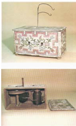
図5：第3巻24ページ。平賀源内作エレキテル通信総合博物館蔵静電式医用電気具（摩擦起電機）。 ハンドルを回して筐の中の瓶にたくわえ、筐上部に突出した銅線から放電し治療者に帯電させた。「諸痛のある病人の痛所より火をとる器なり」と文献にある。平賀源内は長崎で破損したエレキテルを貰い、1776年江戸で修理・復元した。

たというが、木製であるのに写真で見て実物と見まごう出来である。彼らはこの標本を身幹儀と呼んだ。2年の後、星野良悦は別に1組の木骨を同じ工人に作らせて幕府に献上した。