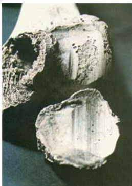
図1：第1巻15ページ「変形した膝関節」

「図録日本医事文化史料集成」 全5巻 三一書房 医学部分館4階に配架。監修：小川鼎三 全巻編集：宗田 一。昭和2年（1927）に誕生した日本医史学会が創立50周年を記念して全国に散在する医事文化の史料を集大成した図録を作った。従来の出版物にはこれほど膨大な史料を図版にした類書はなく、編集するにあたり史料として著名なものでも既に別の出版物で紹介されているものは特に重要なもののみを収録し、未発表の史料をできるだけ多く収録することを心がけたとある。1977年から1978年にかけて発行された。各巻の収録史料は次のとおりである。第1巻（樋口誠太郎編集）：考古資料関係・絵巻物・新撰病草紙、第2巻（酒井シヅ編集）：解剖図・手術図、第3巻（谷津三雄・大塚恭男編集）：医療機器・薬、第4巻（杉田暉道・長門谷洋治編集）：祭祀・信仰・はしか絵・養生・軍事医療・労働衛生・文芸医事、第5巻（矢部一郎・蒲原 宏編集）：人物・各県の医史・医跡。B4の大判で各巻300ページ前後、実に多くの興味をひかれる図や写真が掲載されている中で各巻から1ないし2枚を選んで以下に示す。